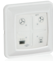
RFT DF/QF 536-0146