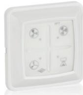
RFT, sparepart 536-0124