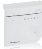
RFT-CO2 sensor 04-00045