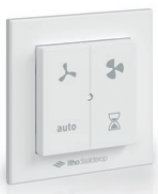
RFT-N AUTO 04-00161

Ventileren moet zo gemakkelijk mogelijk en het liefst zo automatisch mogelijk gaan. Hier heeft Itho Daalderop een aantal handige oplossingen voor. Hieronder het overzicht waarmee het ventilatiesysteem uitgebreid kan worden.