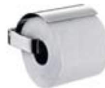
Papierhalter mit Deckel 0500 001* 00