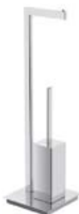
Papierhalter, Bürstengarnitur mit Deckel, Standmodell 0580 001 00

Paper holder, toilet brush set with cover, standing type 0580 001 00