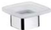
Seifenhalter, Standmodell 0530 001* 01 Kristallglasschale satiniert

Soap holder 0530 001* 00 glass satin crystal