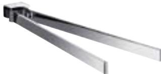
Handtuchhalter, 410 mm 0550 001* 41