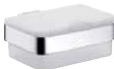
Tissuebox 0539 001 00 Kunststoffbehälter mit Deckel

Soap holder, standing type 0530 001* 01 glass satin crystal