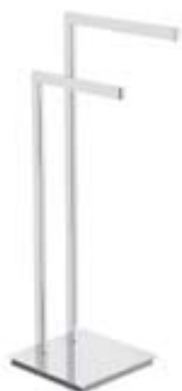
Handtuchhalter, Standmodell 0581 001 00