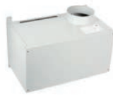
Wand plenum 8 aansluitingen