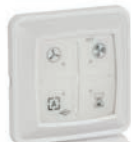
RFT AUTO zender