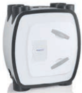
HRU ECO 350 warmteterugwinunit