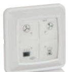
RFT Zender DF