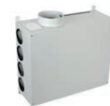
Wand plenum 12 aansluitingen