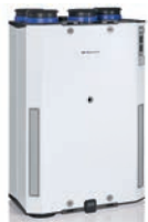
HRU ECO 300 warmteterugwinunit