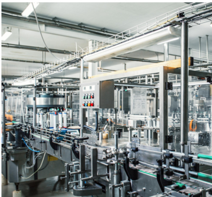
Image of product in real life situation