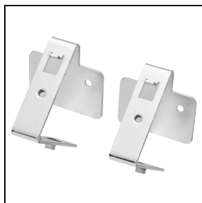
GWS3191 Muurbeugel 30°/45°