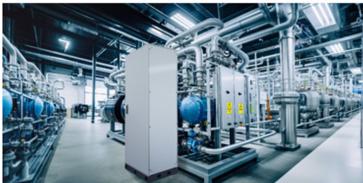
Image of product in real life situation