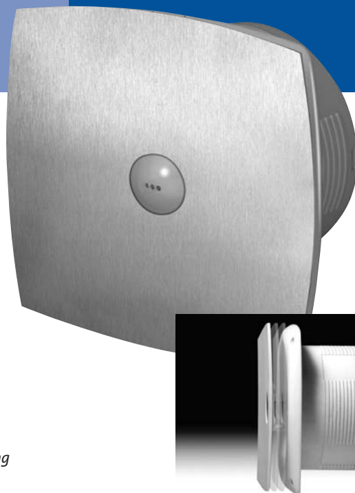
BTV 400 RVS uitvoering

Na uitschakelen draait de ventilator nog een instelbare tijdtijd (45 seconde tot 15 min.) na.