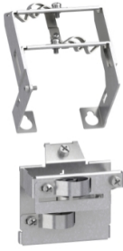
plate for EMC mounting - for variable speed drive - Size 1