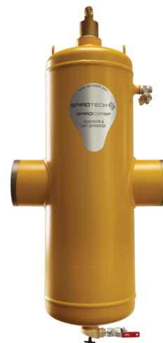
Image du produit