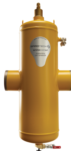
Image du produit