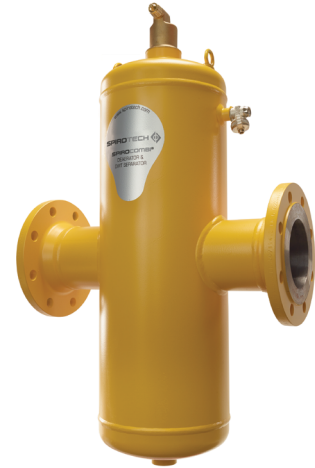
Image du produit