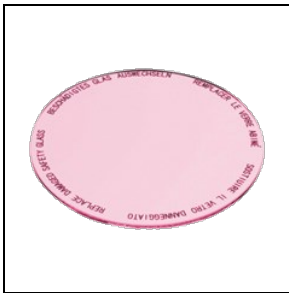
8435961 Levensmiddelenfilter voor vleesproducten