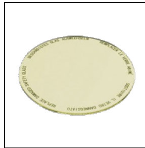
8435963 Levensmiddelenfilter voor fruit en kaas