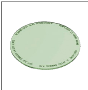
8435964 Levensmiddelenfilter voor groenten