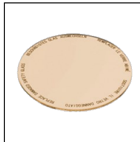
8435962 Levensmiddelenfilter voor bakkerijproducten