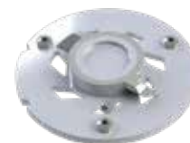
Vermaler Pro X K2