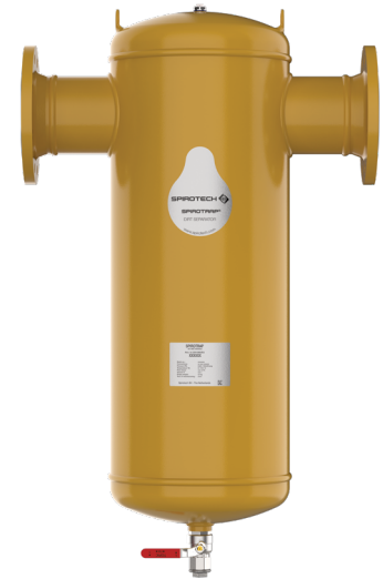
Image du produit