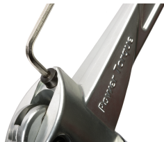
MamfileID: 30107 4040_expander_detail1.tif