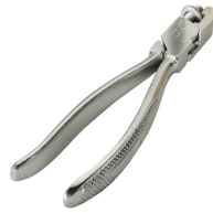
MamfileID: 32118 920_4578_aushals_nockenzange_22080_p02.tif