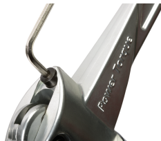
MamfileID: 30107 4040_expander_detail1.tif