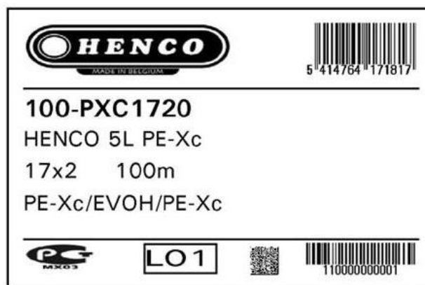
Fig. 1 Afbeelding label

De markering op de verpakking gebeurt door middel van label. De markering is als volgt (voorbeeld van PE-Xc 17x2):