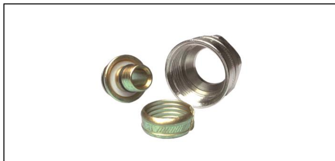
Fig. 2 Koppeling

De verschillende koppelstukken, verenigbaar met het Euroconus gamma, worden in de Henco Schroef prijslijst vermeld.