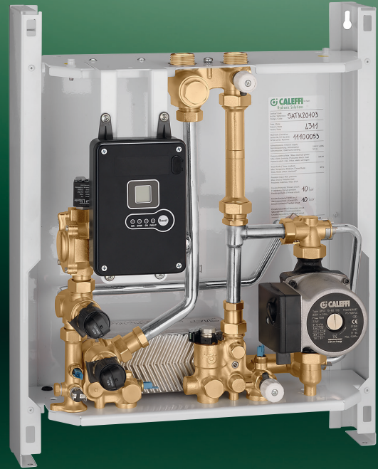
SATK20103HE UITVOERING VOOR LAGE TEMPERATUREN