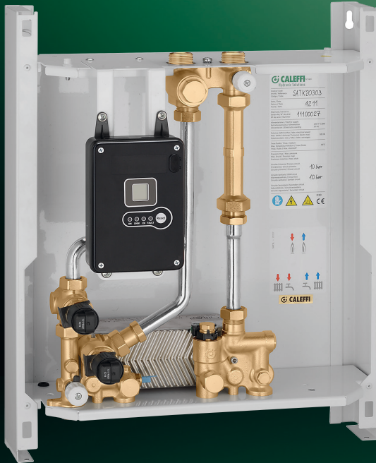
SATK20303 UITVOERING VOOR HOGE TEMPERATUREN