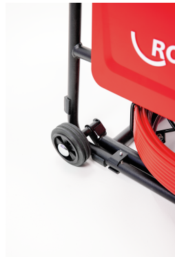
MamfileID: 70706 1500002613_rocam_4_plus_d03.tif