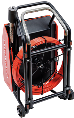
MamfileID: 70704 1500002613_rocam_4_plus_p02.tif