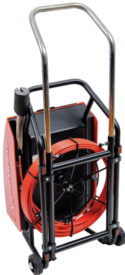
MamfileID: 70711 1500002613_rocam_4_plus_p03.tif