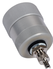
MamfileID: 21146 rocam_4_plus_pruefadapter_1500002616_d05.jpg