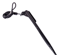
MamfileID: 21145 rocam_4_plus_monitor_stift_1500002616_d08.jpg