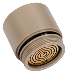
MamfileID: 21147 rocam_4_plus_sender_33khz_1500002616_d06.jpg