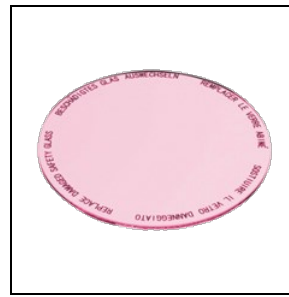
8435961 Levensmiddelenfilter voor vleesproducten