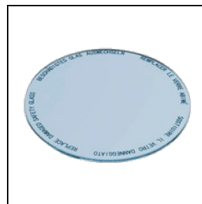
8435965 Levensmiddelenfilter voor visproducten

Om een constante actualisering van haar producten te bevorderen, behoudt PERFORMANCE in LIGHTING zich het recht voor om zonder voorafgaande kennisgeving, wijzigingen aan te brengen. Daarom is het altijd aan te raden om de laatste versie te lezen die op de website www.performanceinlighting.com is gepubliceerd. Geleverde lumenoutput en stroomverbruik, inclusief verliezen, zijn onderhevig aan een tolerantie van +/-7%. Tenzij anders vermeld, gelden de waarden bij een omgevingstemperatuur van 25°C. De garantievoorwaarden zijn beschikbaar op https://www.performanceinlighting.com/qr/company/led-warranty