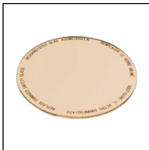
8435962 Levensmiddelenfilter voor bakkerijproducten