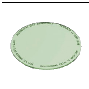
8435964 Levensmiddelenfilter voor groenten