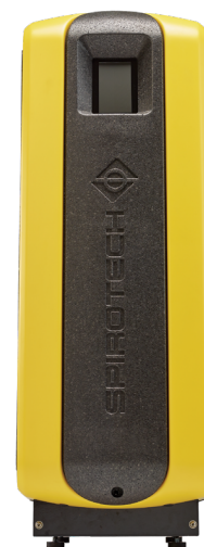
Image du produit