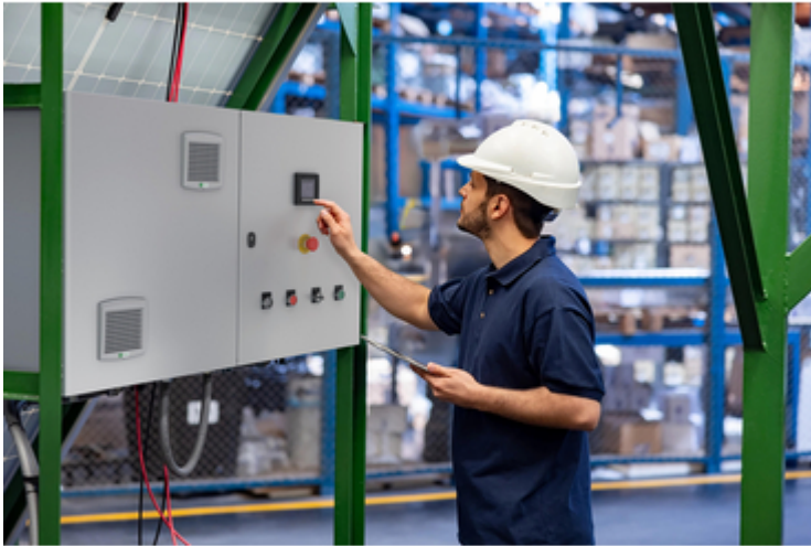
Image of product in real life situation