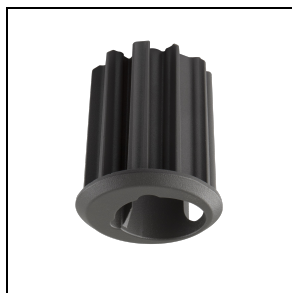
3106386 Adapter mast Ø 42÷46 mm ■ AN-g6 / Antraciet