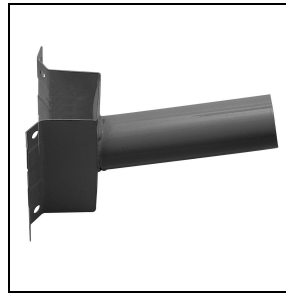
14077796 Gegalvaniseerde stalen wandsteun , met cataphorese polyester poeder afwerking ■ AN-g6 / Antraciet

Om een constante actualisering van haar producten te bevorderen, behoudt PERFORMANCE IN LIGHTING zich het recht voor om zonder voorafgaande kennisgeving, wijzigingen aan te brengen. Daarom is het altijd aan te raden om de laatste versie te lezen die op de website www.performanceinlighting.com is gepubliceerd. Geleverde lumenoutput en stroomverbruik, inclusief verliezen, zijn onderhevig aan een tolerantie van +/-7%. Tenzij anders vermeld, gelden de waarden bij een omgevingstemperatuur van 25°C. De garantievoorwaarden zijn beschikbaar op https://www.performanceinlighting.com/qr/company/led-warranty