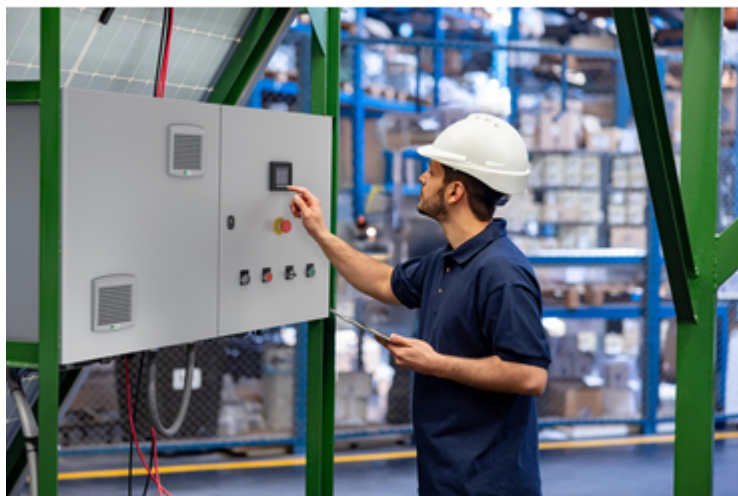
Image of product in real life situation