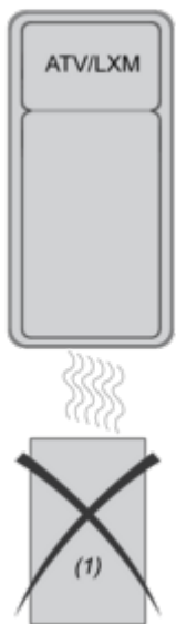
(1) Braking resistor