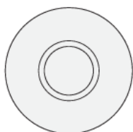
Schéma de câblage