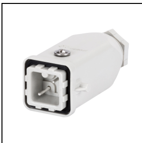
GWS3194 Mannelijke 4-polige connector 10 A