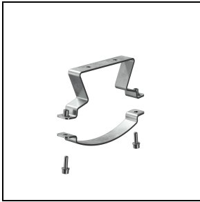
GWS3296 RVS beugel van AISI 316L