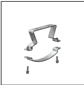
GWS3296 RVS beugel van AISI 316L