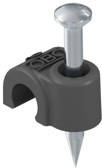
ISO-nagelclip, kort model