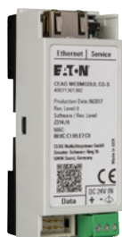
Optionales Webmodul LP-STAR, zur Nachrüstung