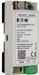
Optionales Webmodul LP-STAR, zur Nachrüstung