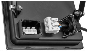
Easy Connect met push terminals