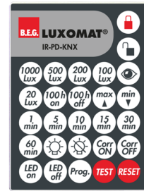
IR-PD-KNX Art.nr.: 92123

Afmetingen: 47 x 19 x 10 mm Beschermingsgraad/-klasse: IP20 Omgevingstemperatuur: -20 °C tot +40 °C