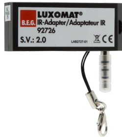
IR-Adapter voor Smartphones Art.nr.: 92726

Afmetingen: 40 x 55 x 103 mm Kleur: zwart Frequentie: 2.4 GHz ISM band, GFSK 0.2 dBm + 5.3 dBi = 5.5 dBm