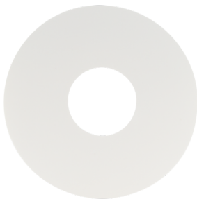
Afdekring PD11 Art.nr.: 92692

Afmetingen: Ø 52 x 3 mm Behuizing: polycarbonaat, UV- bestendig Kleur: zwart, overeenkomstig RAL9005