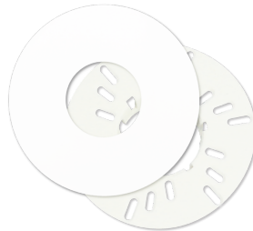
VZ-Adapter set / PD11 Art.nr.: 92833

Afmetingen: 57 x 35 x 7 mm Kleur: - Accu: Lithium 3.0 V <BR>0 mAh