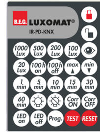
IR-PD-KNX Art.nr.: 92123

Afmetingen: 47 x 19 x 10 mm Beschermingsgraad/-klasse: IP20 Omgevingstemperatuur: -20 °C tot +40 °C