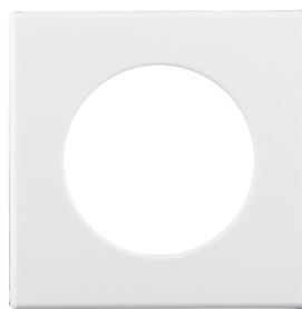
Vierkant designraam PD11-IB Art.nr.: 92994

Afmetingen: Ø 100 x 3 mm Behuizing: polycarbonaat, UV- bestendig Kleur: wit mat, overeenkomstig RAL9010