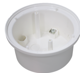
Opbouwsokkel PD11 Art.nr.: 92121

Afmetingen: 54 x 54 x 2.6 mm Behuizing: polycarbonaat, UV- bestendig Kleur: wit mat, overeenkomstig RAL9010