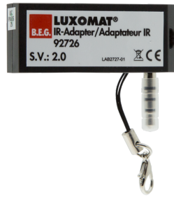
IR-Adapter voor Smartphones Art.nr.: 92726

Afmetingen: 40 x 55 x 103 mm Kleur: zwart Frequentie: 2.4 GHz ISM band, GFSK 0.2 dBm + 5.3 dBi = 5.5 dBm